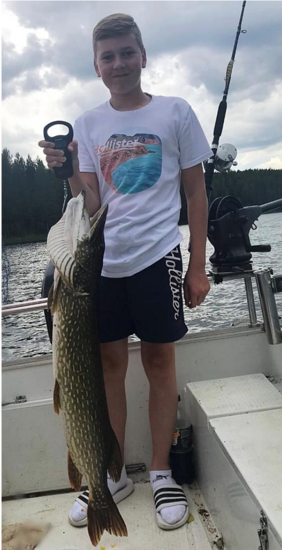
Seanin haukiennätys meni uusiksi Vihtasen edustalla