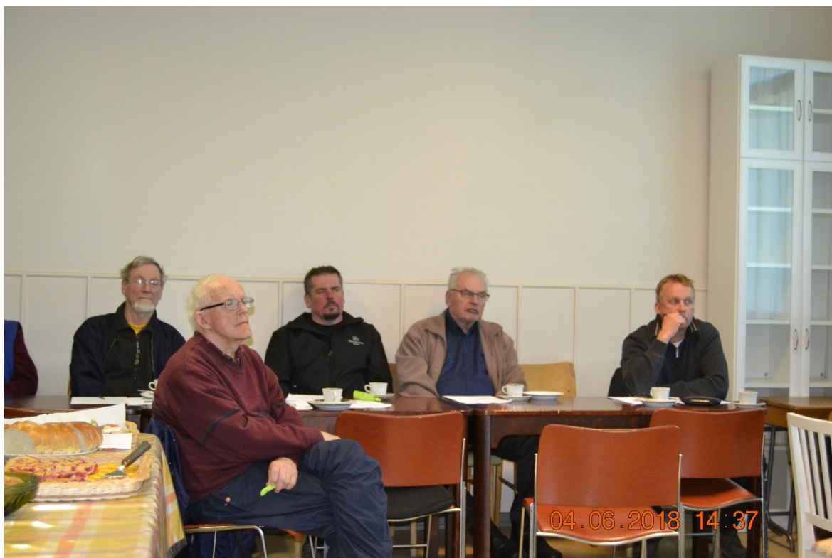
Kalamiehet täynnä intoa kokoustamassa