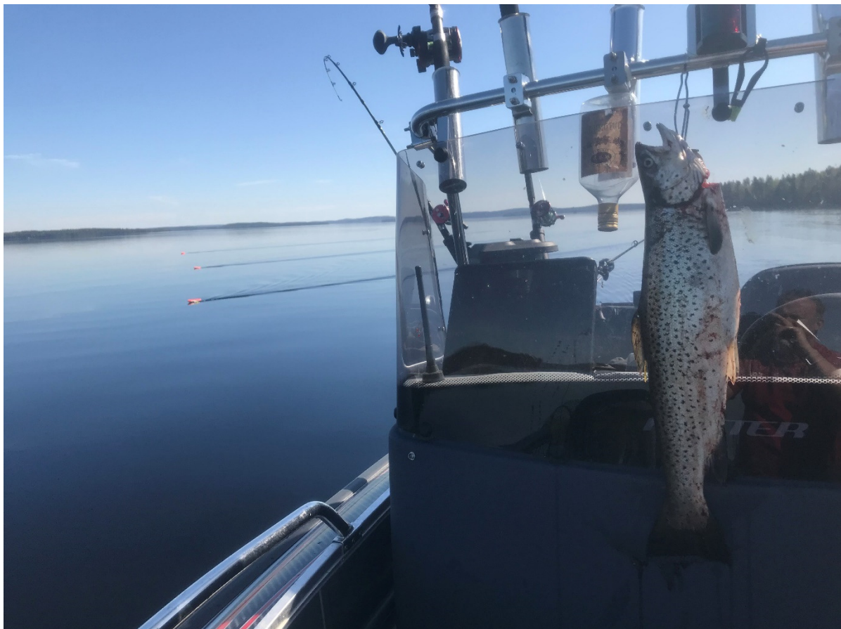
Aurinkokuivattua taimenta tarjolla