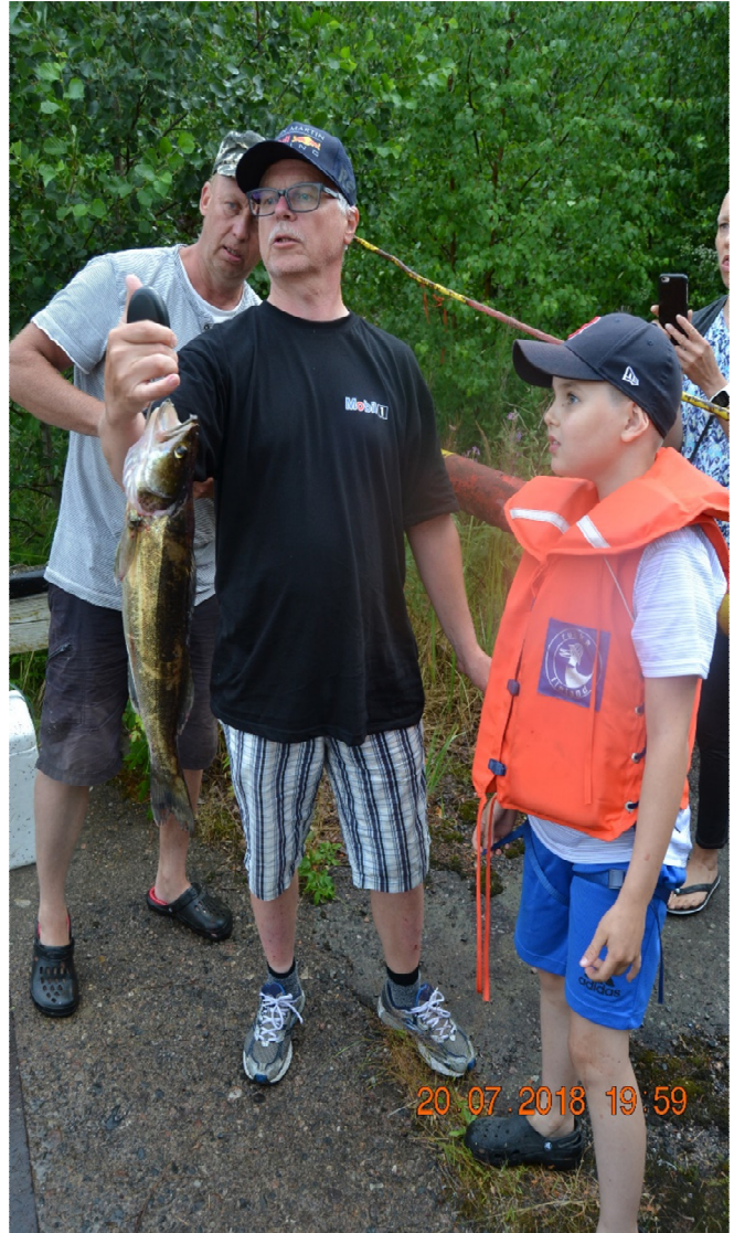
Judinsalo-uistelun suurin kuha