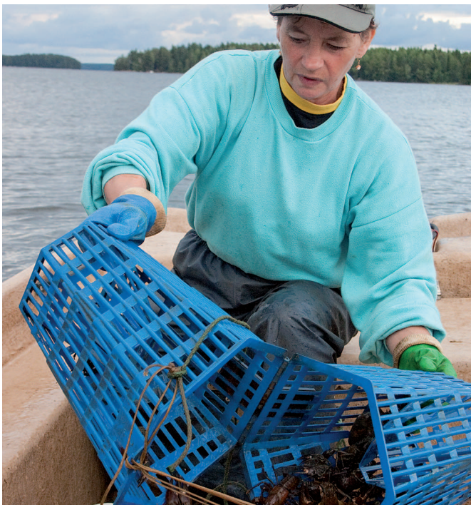
Ravustukseen ja muuhun pyydyskalastukseen tarvitaan aina vesialueen omistajan lupa.

Osakaskuntia voi etsiä internetissä kalastusalueen kautta osoitteessa www.ahven.net/kalastusalue . Jos tiedät osakaskunnan nimen tai kiinteistörekisteritunnuksen, voit tiedustella sen yhteystietoja Maanmittauslaitokselta tai Aluehallintovirastolta. Osakaskuntien rajat on mahdollista nähdä Paikkatietoikkuna.fi -sivustolla.