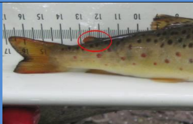
Rasvaevällinen luonnonkala