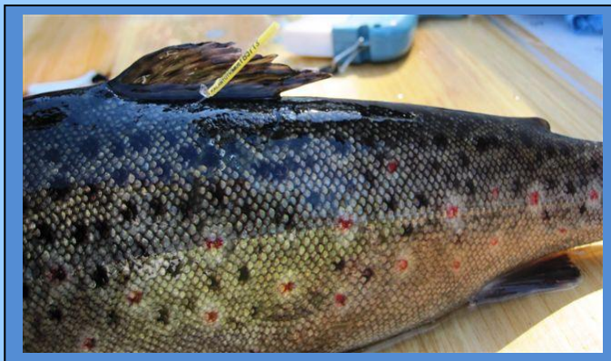
Ankkurimerkillä merkitty taimen