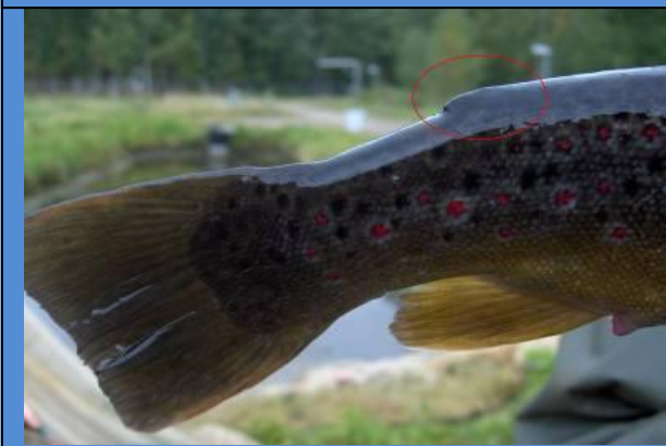
Eväleikattu istukastaimen

Päijänteiden villi taimen on uhanalainen. Siksi koko Päijänteiden alueelle on annettu suositus luonnossa syntyneiden taimenten vapauttamiseksi. Villin taimenen erottaa istukkaasta rasvaevä, joka istukkaalta on leikattu pois.